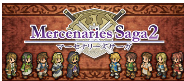
「マーセナリーズサーガ2」のテーマ