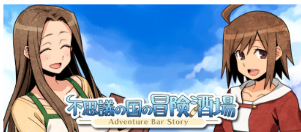
「不思議の国の冒険酒場」のテーマ

また、ゲームタイトル毎に2点のテーマ・150円（税込み）のお買い得セットも実施しております。